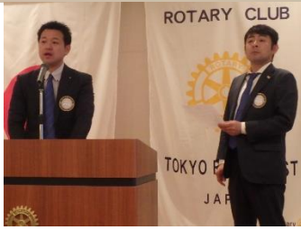
(飯塚副会長と西野幹事)