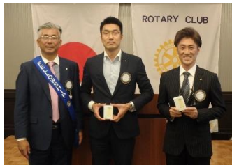
(栗山会長、大星会員、島崎会員)