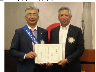
(栗山会長、油井会員)